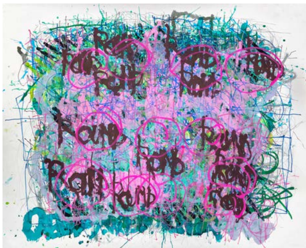
Dan Miller, Sans titre , 2021 © Creative Growth Art Center

Atelier Richelieu — 15-18 septembre 2022