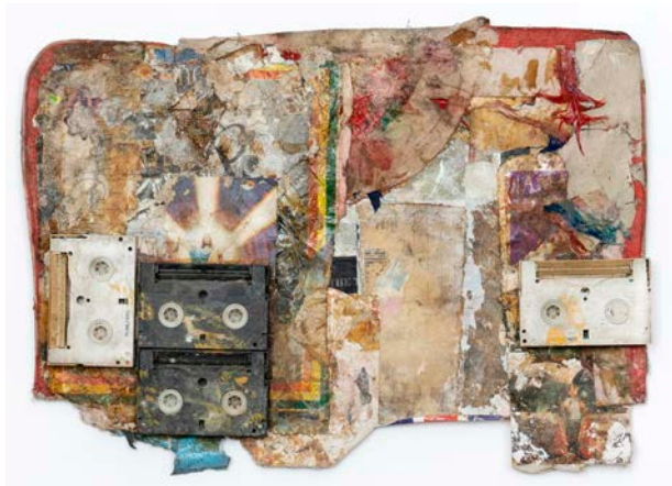
Lee Scratch Perry, Untitled collage unknown (circa mid 2000's)

L'Outsider Art Fair (OAF), seule foire dédiée à l'art autodidacte, l'art brut et l'art outsider, a le plaisir d'annoncer les exposants de sa 10 e édition à Paris – la première édition en présentiel depuis 2019. OAF Paris revient à l'Atelier Richelieu du 15 au 18 septembre 2022 , avec 30 exposants de 24 villes représentant 13 pays .