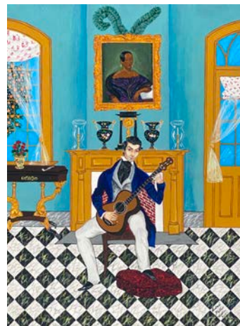
Andrew LaMar Hopkins, New Orleans Creole Guitarist , 2022